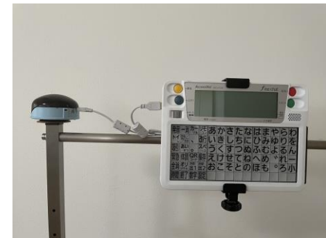
ファイン・チャットと一緒に取り付けられたところ